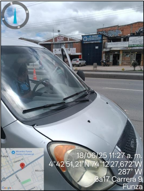
Ilustración No. 3. Operativo pedagógico fuentes móviles.