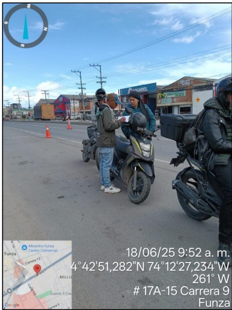
Ilustración No. 4. Operativo pedagógico fuentes móviles.