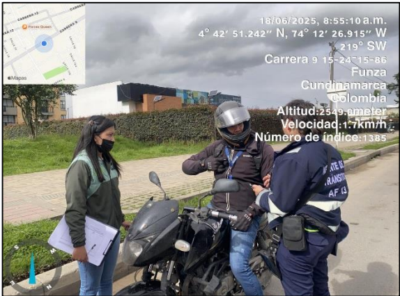
Ilustración No. 1. Operativo pedagógico fuentes móviles.