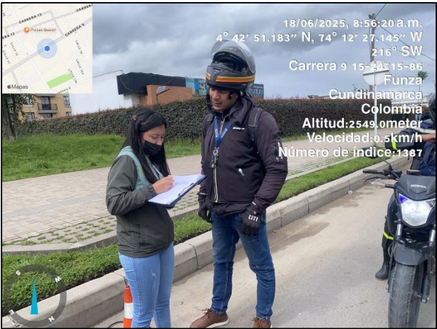
Ilustración No. 2. Operativo pedagógico fuentes móviles.